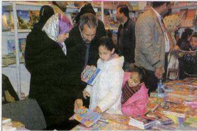
Promouvoir la lecture auprès des jeunes est l'un des objectifs du salon international du livre de Casablanca. Les organisateurs tablent sur plus de 500.000 visiteurs, dont 80.000 jeunes et écoliers

humains (CNDH) et plus de 3.000 titres. Plusieurs nouveaux titres paraîtront également à l'occasion de cette édition du Siel dans la collection du CCME.