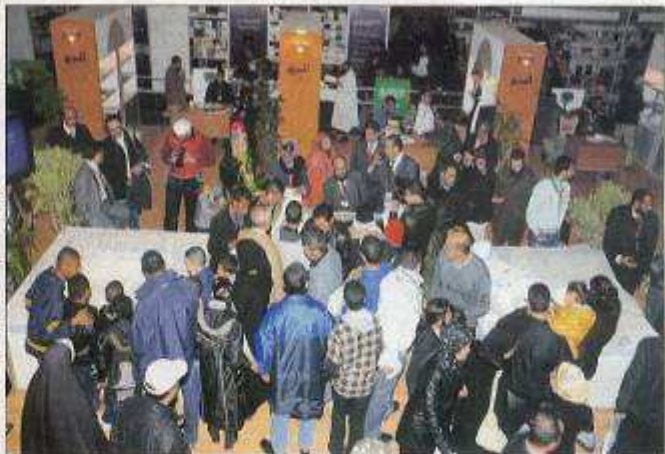
Le pavillon de l'Arabie saoudite, invitée d'honneur de cette édition, ne désemplit pas. Il s'agit du plus grand stand du salon (592 m 2)