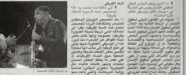
من مهرجان كادرا بالمصيرة

البعيد الإفريقي في علاقة بما ختمت به لادا. تخصيص هذه الصورة للاحتفاء بباريقا؟ بعد تخصيص الورش السابقين للسياحة والثقافة ففرنا تخصيص مندى هذه السنة لإفريقيا، نظرا إلى العقالة التي تربط مدينة الصويرة بباريقا، خصوصا وأنا كانت تعتبر ميناء القوافل عبر الصحراء منذ فزون. كما أن توسيفي، الكاوية، لديها جنود هي حق إفريقيا، إلى جانب أنها محاولة لتكبير بعض الأفعال المسببة والصورة المنطحة حول النساء الإفريقيات، إذ على عكس ما يعتقد البعض أصبح مجتاز ومتميز كاتبات عجائبات مثل التحريرية، مغربي، استثنائي، صاحبة روحية أمريكياتنا، والتي يباع منها أكثر من مليون نسخة. كما أنها متنامية لتسطح التربة على الحجر، إذ يفكر فيها دائما على الهامش وأن الجاليات الإفريقية يوما ستلحق من الجنوب إلى الملة في بنما عرقنا اليوم أن 80 في الملة من الحركات الإفريقية تتم داخل إفريقيا. أي تلتور حركة جنوب إفريقي، ولكن نمو الأمل الأوروبي تقافي لهذه الجاليات، الآن ما بين 16 و18 في الملة من مغاربة العالم برسوا. 6 سنوات بعد الكاوية، وأخيرا، كما السباق نحدثت عن هجرة الأسمعة، فيما أن عدة ظروف يظهر أن جزء من الجاليات الأوروبية يتجمع في المجتمعات الأوروبية. ولكن في الوقت نفسه يطمح حركة (circulation)