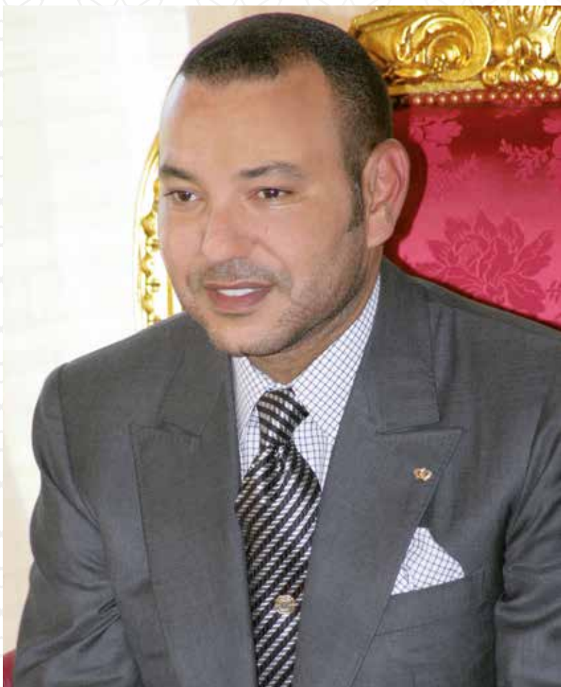
Sa Majesté le Roi Mohammed VI

«Compte tenu de la nécessaire complémentarité devant exister entre les composantes matérielles et morales du développement humain, nous nous attachons à donner à la culture toute l'importance et tout l'intérêt qu'elle mérite. Nous sommes, en effet, convaincu qu'elle est le ciment de la cohésion de la nation, et le miroir de son identité et de son authenticité.